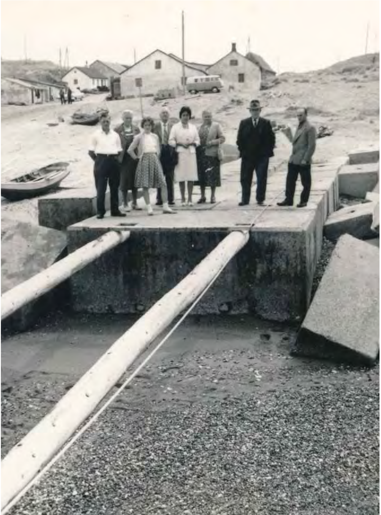
Stenbjerg Landingsplads - Etablering af ny mole 1956