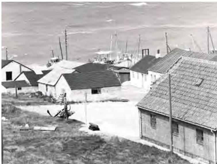
Landingspladsen set fra sydøst, 1965.