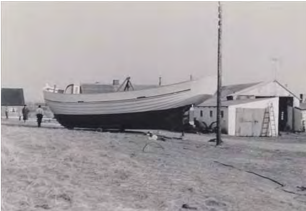
Den sidste båd bygget i 1960'erne i Stenbjerg, T 53, af Christian Jensen Bonde.

"En genskabelse af bådbyggeri vil være en styrkelse af miljøet og give fiskeriet på mere synlighed og mere tilstedeværelse."