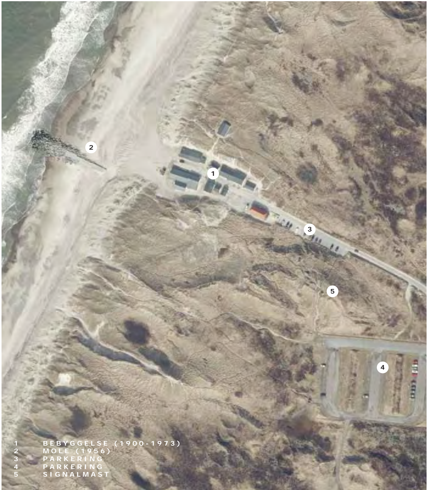
Luftfoto af Stenbjerg Landingsplads, 1:2000