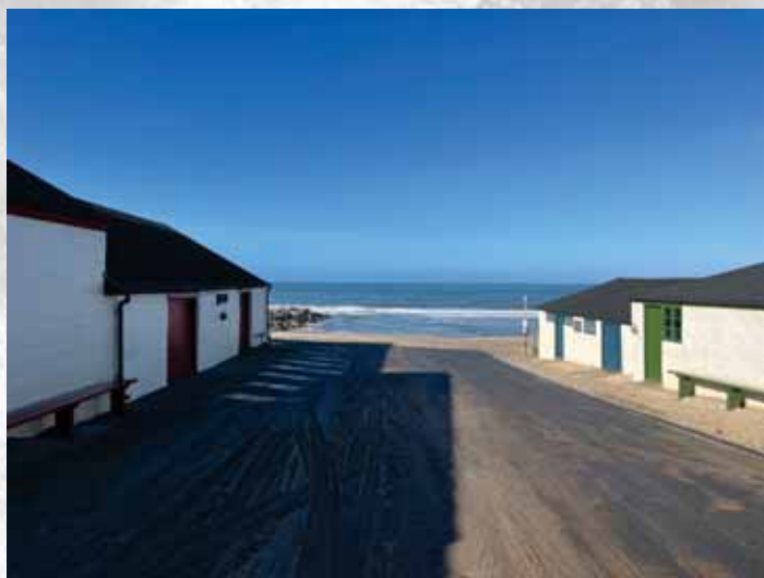
Husenes facadelinje mod vejen skaber kigget til Vesterhavet