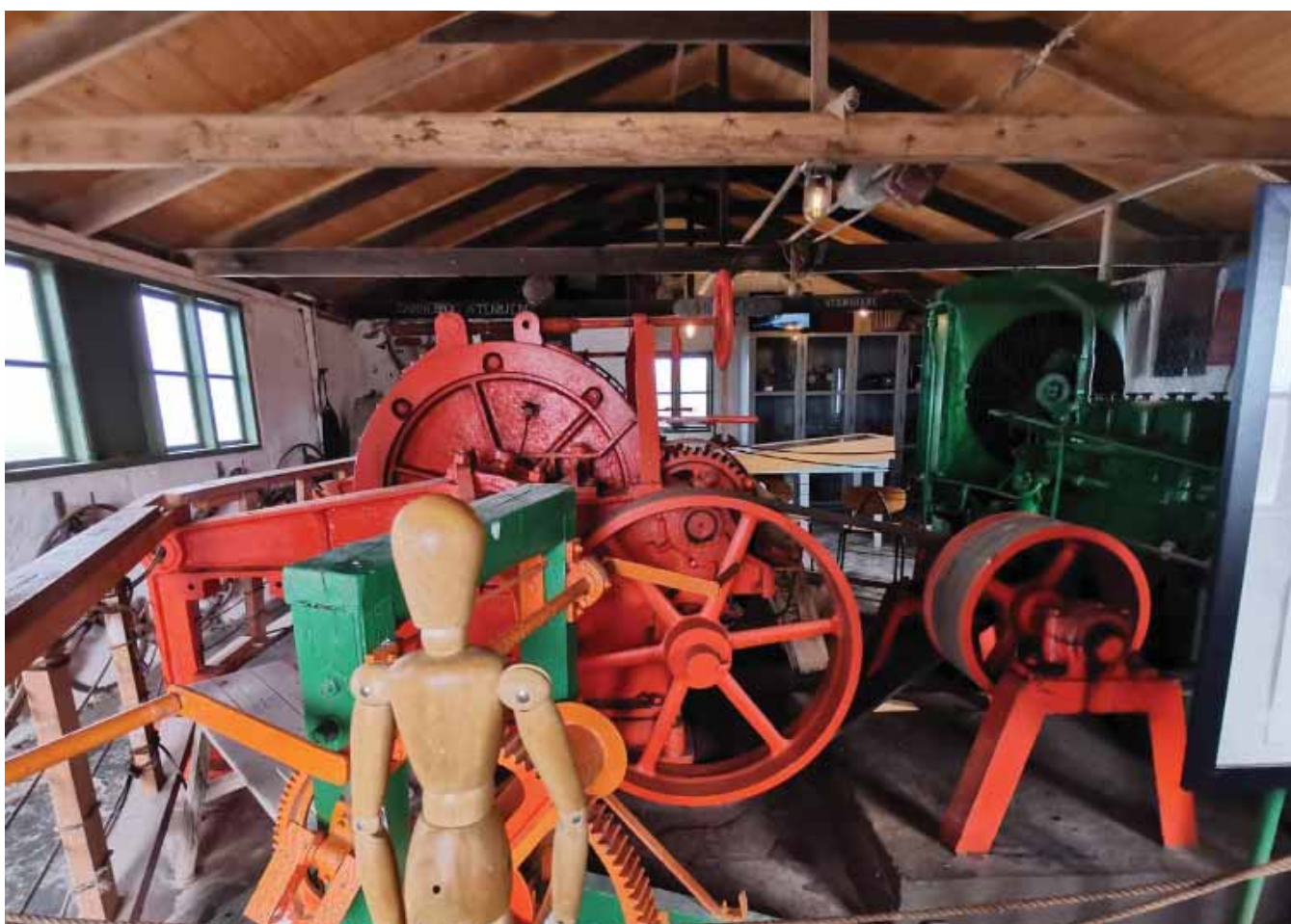
Eksisterende udstilling i Spilhuset