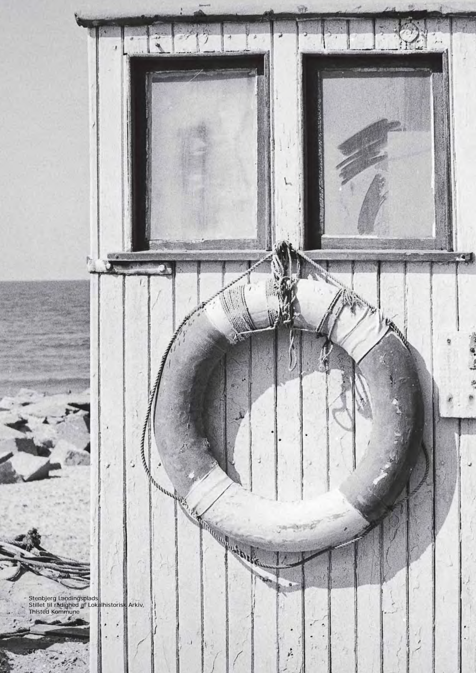
Stenbjerg Landingsplads