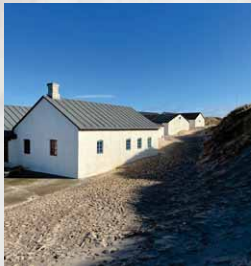
Husenes forskydninger mod klitterne skaber en blød overgang mellem bebyggelse og natur