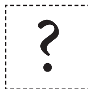
FORENINGEN TIL BEVARELSE AF STENBJERG LANDINGSPLADS

Det anbefales, at Stenbjerg Landingsplads forsat skal være visuelt til stede som destination hos Nationalpark Thy, Cold Hawaii, Destination Vestkysten mv. Det skal blot sikres, at Foreningen til Bevarelse af Stenbjerg Landingsplads fremstår langt tydeligere som afsender og modtager af donationer, der går til ambitionen om en bæredygtig turisme for Stenbjerg Landingsplads, der understøtter organisationens udfordringer med bl.a. drift og vedligehold af kulturarven.