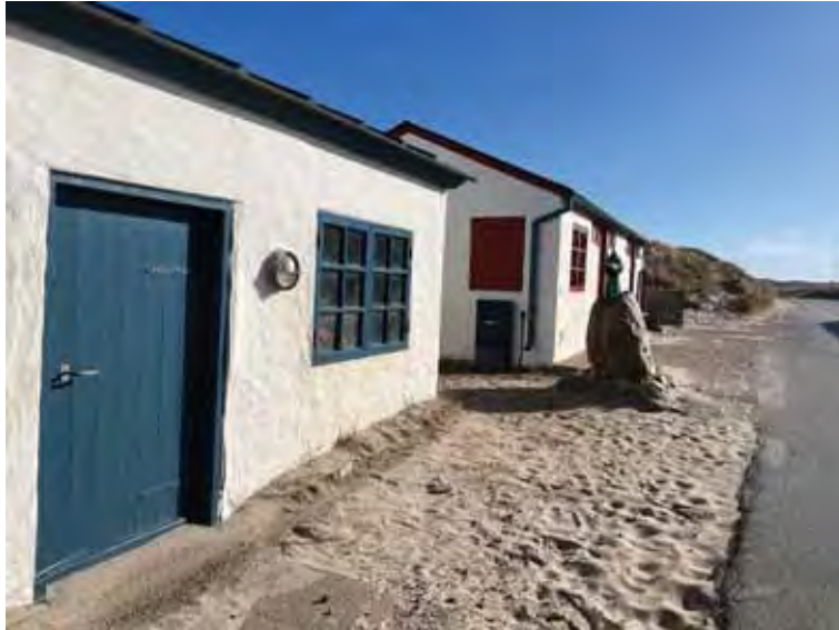
Redskabshus (1) og Infohuset (14) fra 1973.