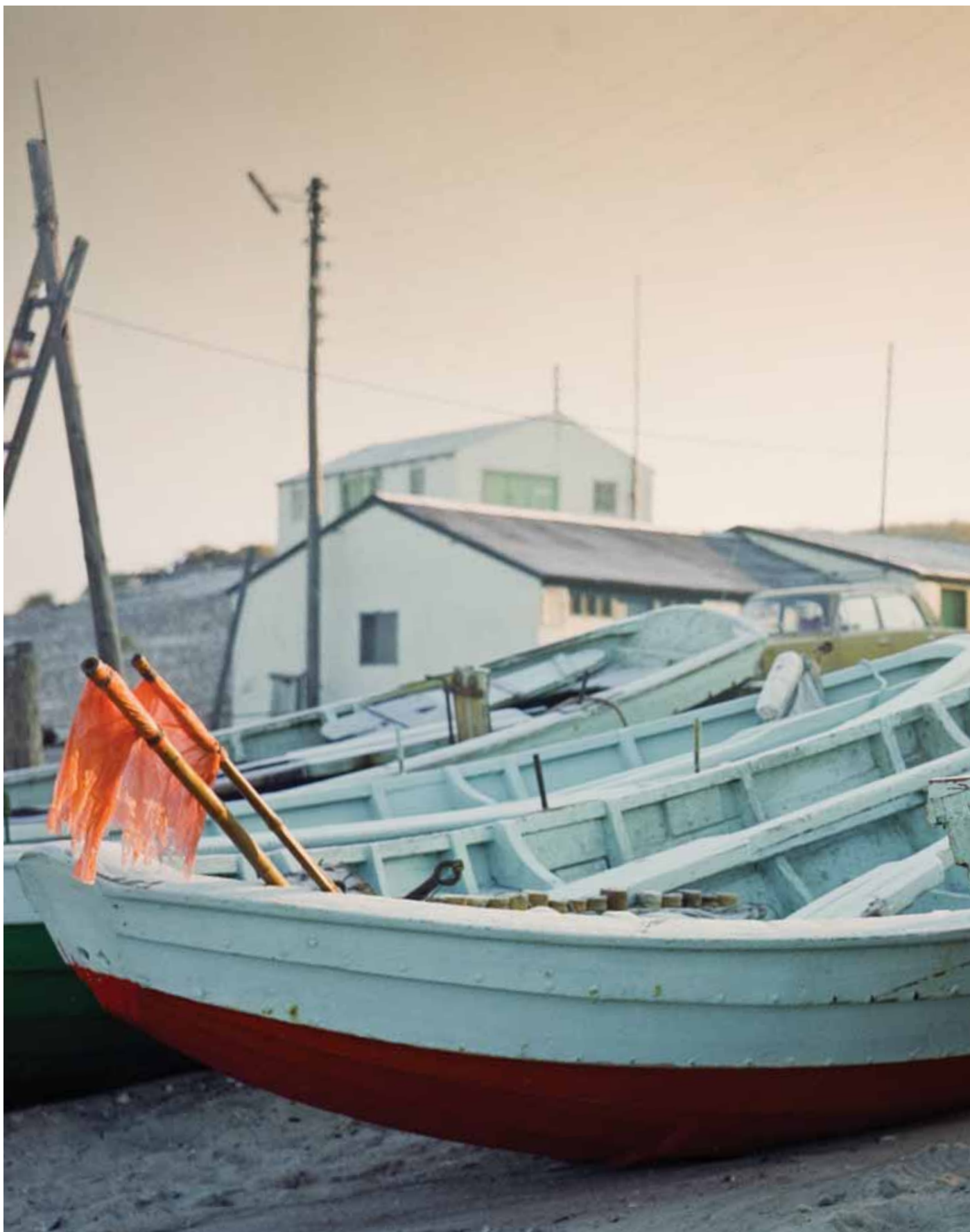
Stenbjerg Landingsplads