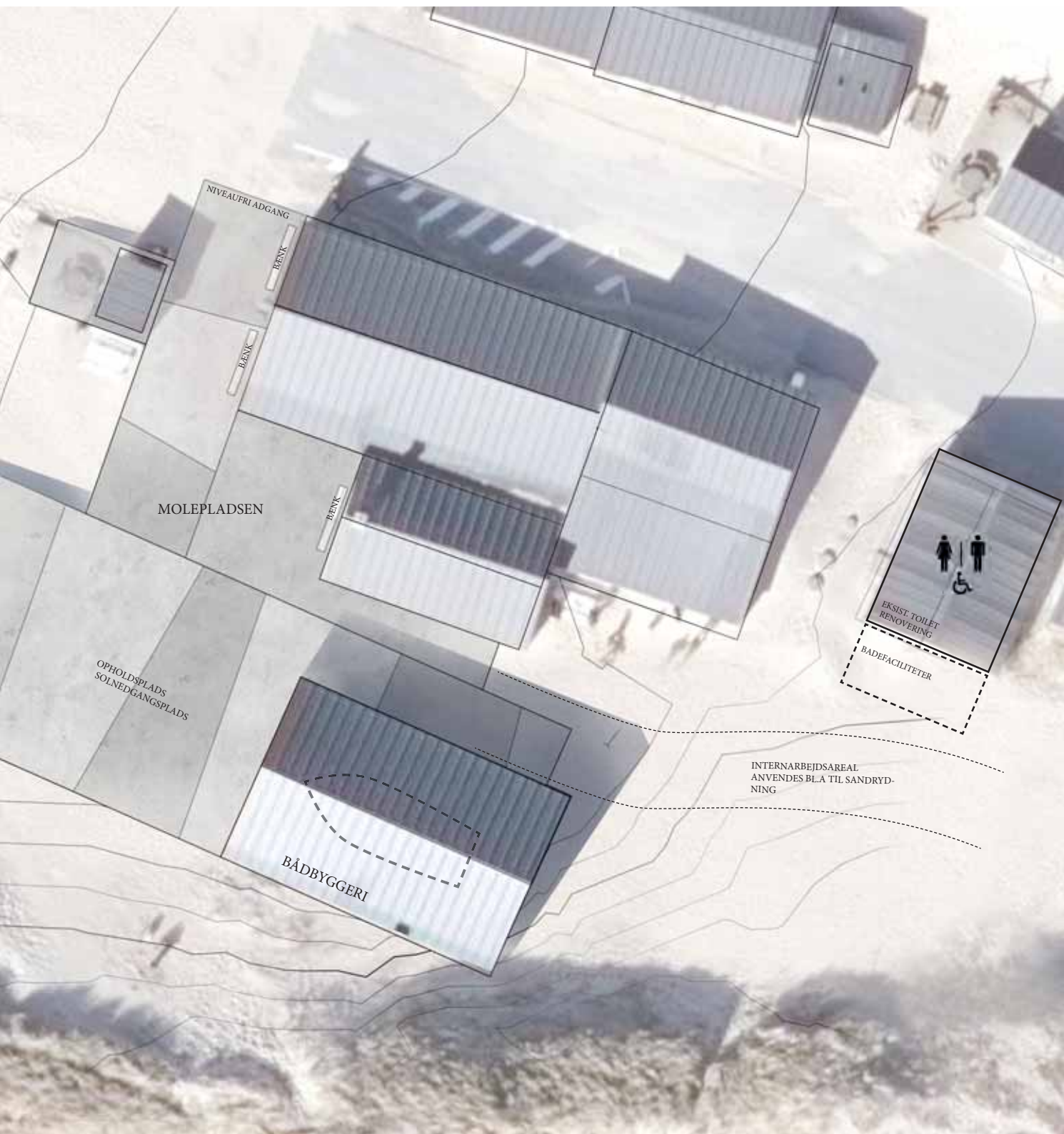
Situationsplan, P+P Arkitekter