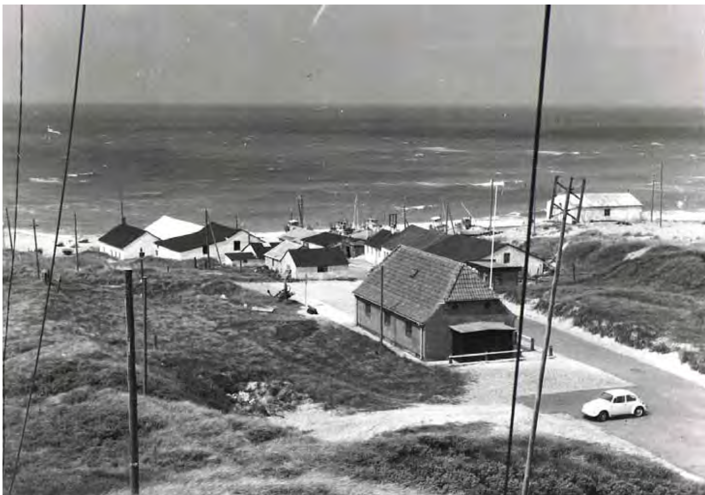
Stenbjerg Landingsplads set fra Signalmasten