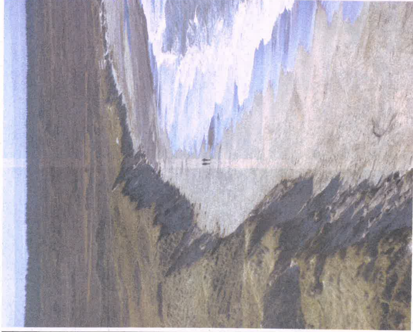
Stranden mellem Lildstrand og fuglefyldet Bulbjerg er ikke ligefrem overrendt.

Har man lyst til mere socialt liv, byder forsamlingshuset, som Hawboerne driver, både på beboermøder, juletræsfest, koncerter, kunsthåndværksmarked og ikke mindst det årlige fiskebord. Huset bruges