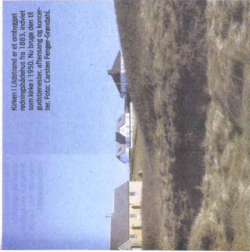
Kirken i Lildstrand er et ombygget redningsbådehus fra 1883, indviet som kirke i 1950. Nu bruges den til gudstjenester, aftenang og koncerter.