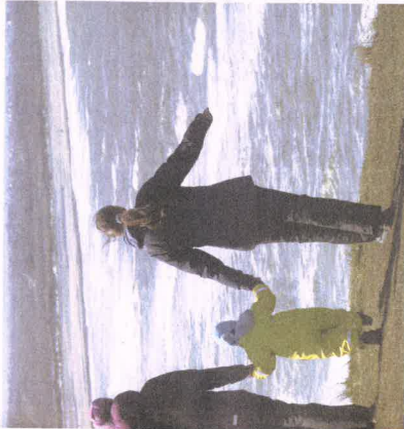
Udsigten fra Danmarks eneste fuglefeld, Bulbjerg. 40 meter over havet, er et svimlende flot panorama.